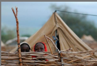
1951 – Convenção relativa ao Estatuto Refugiado