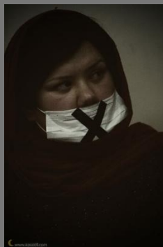
1979 – Conv. Eliminação Violência Mulheres