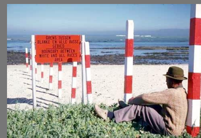
1966 – Pacto Direitos Cívicos e Políticos