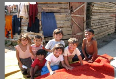
1989 – Convenção Direitos Crianças