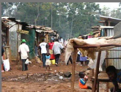
1967 – Pacto Direitos Económicos, Sociais e Culturais