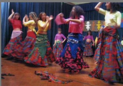
1965 – Conv. Int. Eliminação Discriminação Racial