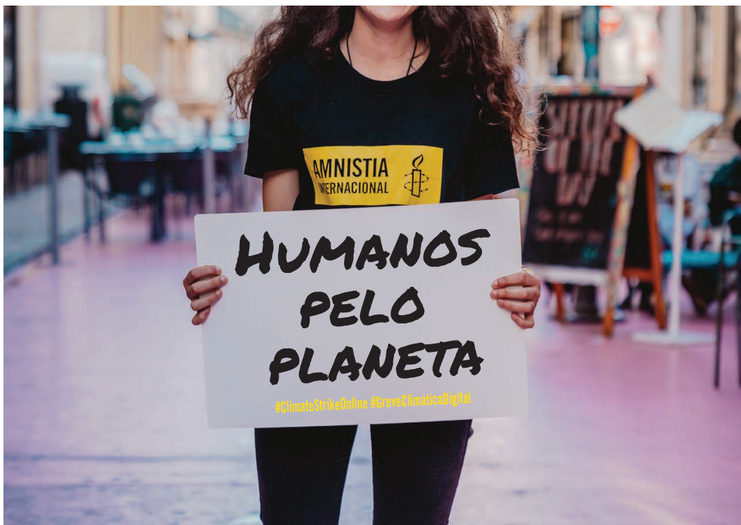
Exemplo de um cartaz